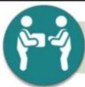
ตัวอย่างบัญชีวัสดุ